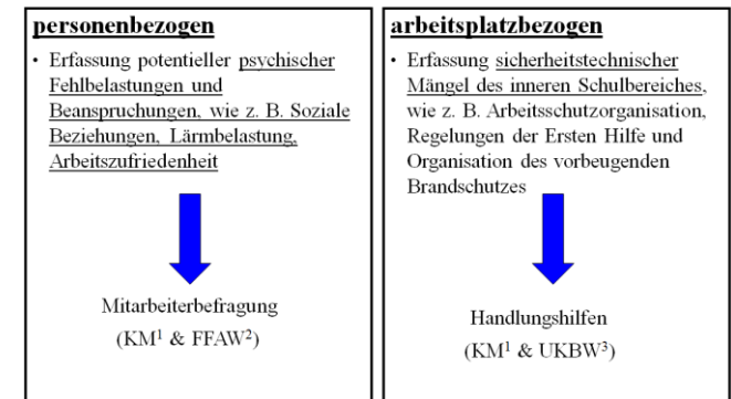
Abb. 2: Gefährdungsbeurteilung für Lehrkräfte

An die Besonderheiten von Schule und Lehrerberuf angepasst, gliedert sich die Gefährdungsbeurteilung für Lehrkräfte in einen arbeitsplatz- und einen personenbezogenen Teil (vgl. Abb. 2).